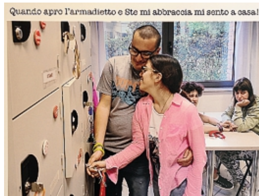
Le foto esposte in via Garibaldi sono accompagnate dalle parole scritte dai ragazzi del Mosaico