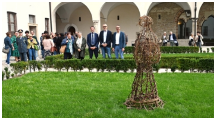
La mostra nata dalla collaborazione tra Asst e coop Il Mosaico

Come in una gigantesca scacchiera, sono stati installati i "pezzi", la torre, il cavallo, la regina e l'alfiere, intrecciando arbusti per omaggiare il genio della land art, Giuliano Mau-